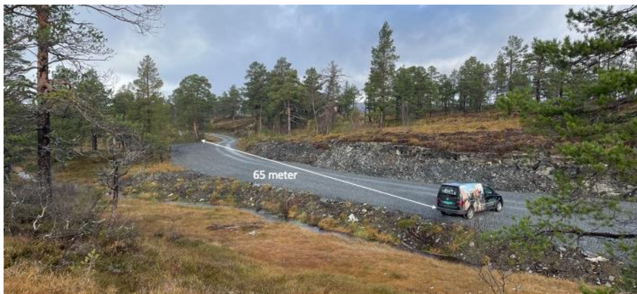
Bilde tatt fra sør mot nord. Bilen er plassert på dagens vestre regulerte grense.

Parkeringsplassen er altså utvidet ca 65 meter lengre mot vest enn det som framgår av gjeldende reguleringsplan og vedtatt byggetillatelse, slik det også går fram av nedenstående bilde, som er innsendt til kommunen fra iTrollheimen AS.