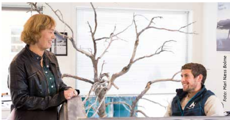
Kontorfellesskapet på Øvre Dalen.